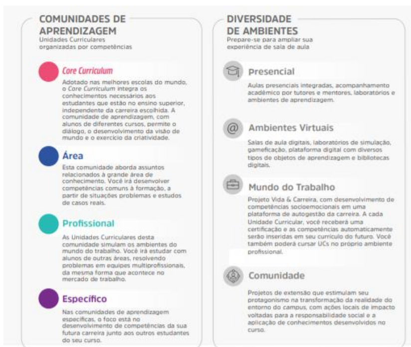
Figura 1 – Comunidades de aprendizagem e diversidade de ambientes

A flexibilidade do Currículo Integrado por Competências permite ao estudante transitar por diferentes comunidades de aprendizagem alinhadas aos seus respectivos eixos de formação. O percurso formativo é flexível, fluído, e ao final de cada unidade curricular o aluno atinge as competências de acordo com as metas de compreensão estudadas e vivenciadas ao longo do semestre.