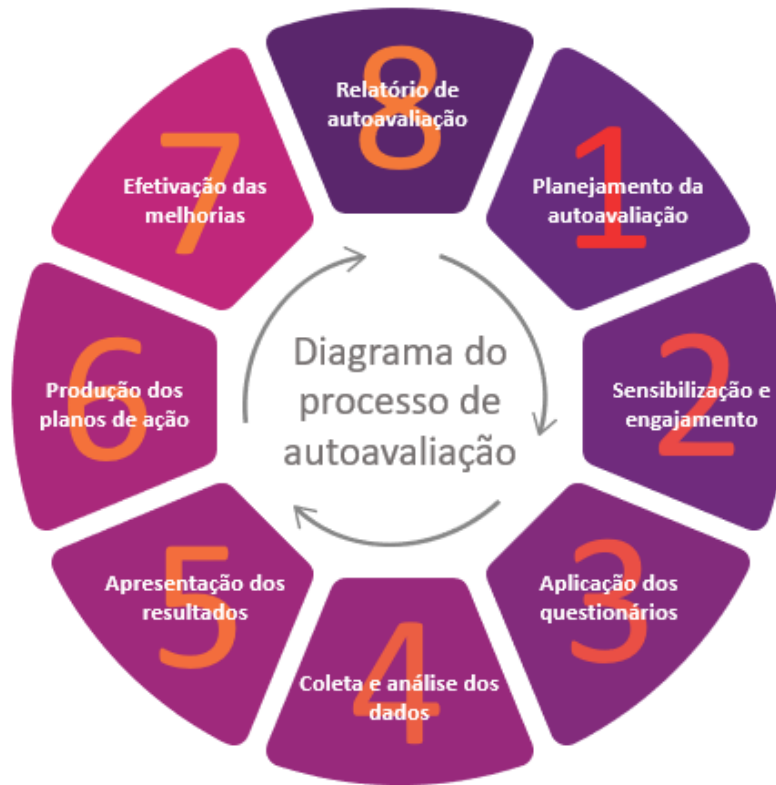
Figura 5 – Diagrama do Processo de Autoavaliação

O processo de autoavaliação da Faculdade Internacional da Paraíba - FPB foi idealizado em oito etapas, previstas e planejadas para que seus objetivos possam ser alcançados, conforme explicitado a seguir.