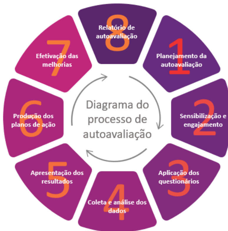
Figura 5 – Diagrama do Processo de Autoavaliação

O processo de autoavaliação da Faculdade Internacional da Paraíba – FPB foi idealizado em oito etapas, previstas e planejadas para que seus objetivos possam ser alcançados, conforme explicitado a seguir.